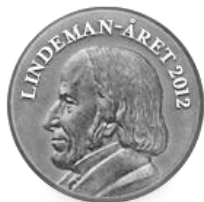
LUDVIG MATHIAS LINDEMAN 1812–1887